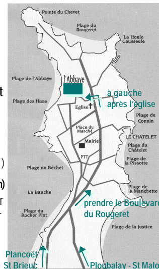
Presqu'île de St-Jacut